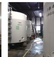
全量サーマルタンク仕込 温度管理を徹底