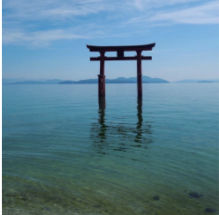
蔵の近くには琵琶湖があり 湖の中に立つ白髭神社の鳥居が有名。

琵琶湖と比良山を擁する山紫水明の地。 「日本の棚田百選」に選ばれた 畑の棚田。蔵からも近くこの棚田で 採れたお米で醸したお酒も限定販売。