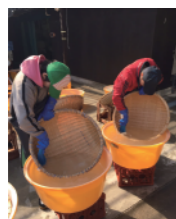
蔵人が一斉に洗米