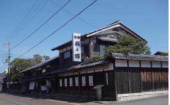
歴史ある酒蔵の外観