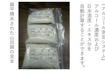
扁平精米された山田錦の見本

琵琶湖と比良山を擁する山紫水明の地。 「日本の棚田百選」に選ばれた 畑の棚田。蔵からも近くこの棚田で 採れたお米で醸したお酒も限定販売。