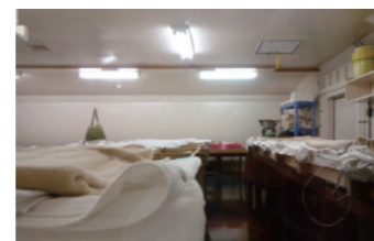
徹底した温度管理が成される麹室