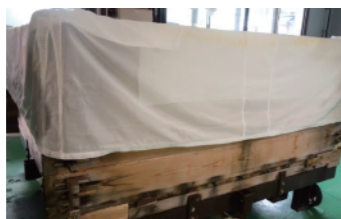
珍しい蒸籠型の蒸し機 (新政でも採用)