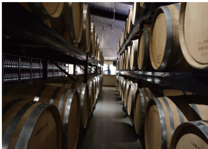
雪室に併設し温度管理された焼酎貯蔵庫