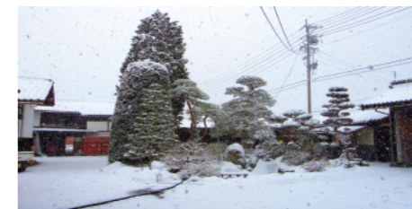
雪の日の佐久乃花 酒蔵外観

720ml 1,430円 (税抜1,300円) 1800ml 2,530円 (税抜2,300円)