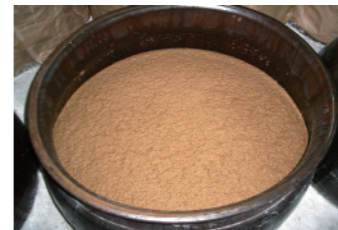
黒糖焼酎のもろみ