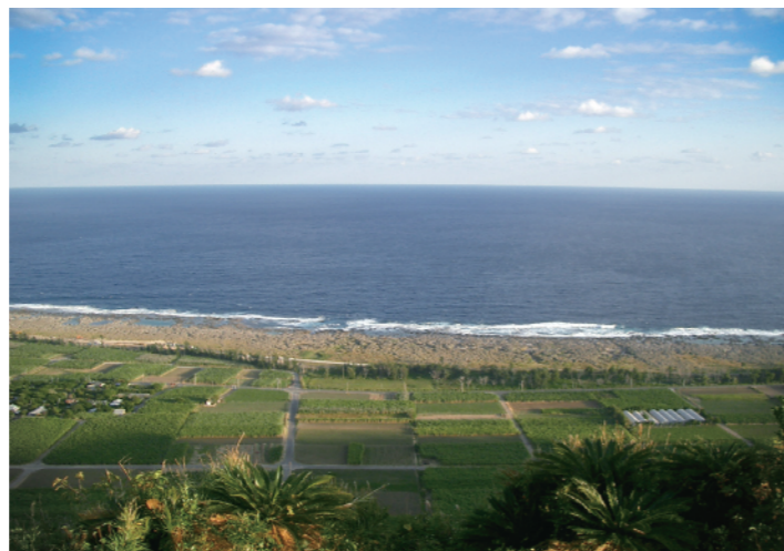
一年を通して温暖な気候の喜界島