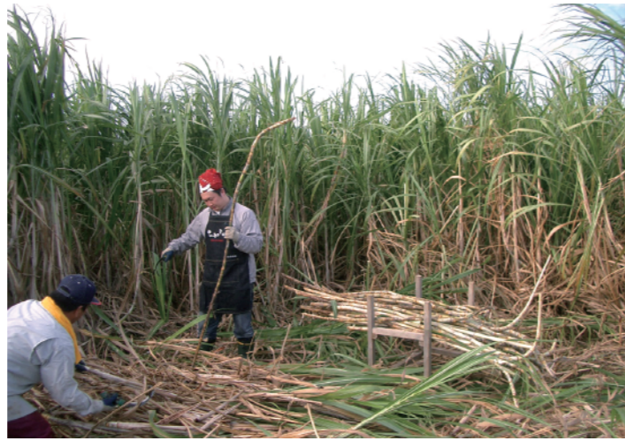
原料となる「さとうきび」の収穫

900ml 1,397 円 (税抜 1,270 円) 1800ml 2,530 円 (税抜 2,300 円)