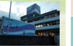
奄美大島の繁華街近くにある営業本部

ブルーボトルは奄美の空と海を表現。 本社工場は奄美大島の南西部にある 自然豊かでサトウキビの産地でもある宇検村。