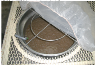
溶かした黒糖液をいれたもろみ