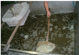
溶解作業 アクを丁寧に取ります。