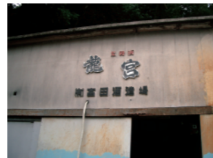
奄美大島にある蔵

720ml 3,000 円 (税抜 2,727 円) 1800ml 7,300 円 (税抜 6,636 円)