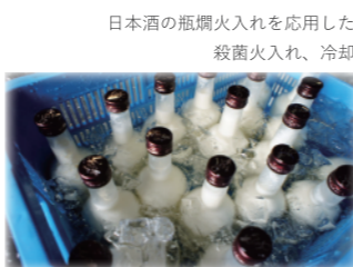
日本酒の瓶燻火入れを応用した 殺菌火入れ、冷却