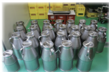
会津中央乳業から届いたしぼりたての新鮮なヨーグルト

720ml 1,733円 (税抜1,575円) 1800ml 3,465円 (税抜3,150円)